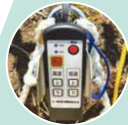
無線操作スイッチ