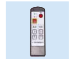
②無線操作スイッチ