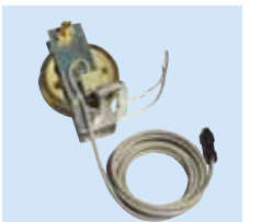
③リミット滑車セット