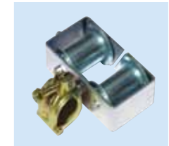
④中間サイドローラー