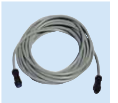
⑤リミット中継コード